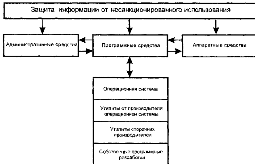
Рис. 1. Защита информации от несанкционированного использования

Для обеспечения эффективной безопасности вычислительной системы необходимо использовать все три выше описанные составляющие. Однако внедрение самых эффективных систем защиты вычислительной техники от несанкционированного использования может обойтись очень дорого, но это еще не значит, что у вас будут все необходимые возможности по управлению политикой безопасности. Поэтому многие организации стремятся создавать собственные программные комплексы для обеспечения защиты от несанкционированного использования вычислительной техники. При этом программным путем можно следить за всеми действиями пользователя корпоративной сети, но это неприемлемо для глобальных сетей.