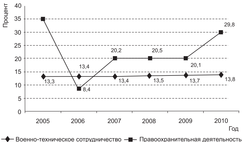
Рис. 1. Динамика расходов бюджета Союзного государства на обеспечение безопасности Союзного государства в 2005–2010 гг.