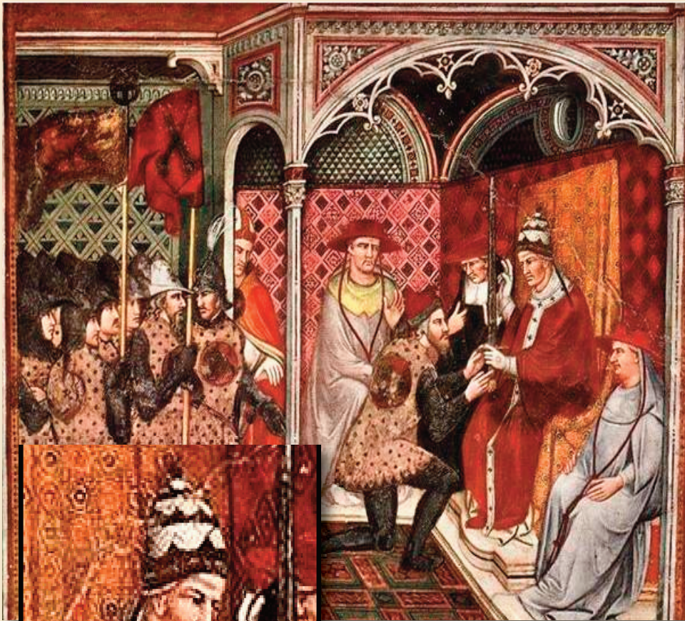
Рымскі Папа Аляксандр III.

рыяй” 4 . Лазінскі ўвогуле бачыць тут барацьбу класаў 5 . Акрамя барацьбы, абумоўленай сацыяльна-эканамічнымі супярэчнасцямі, мы можам назіраць таксама вельмі важнае для ўсведамлення прычын папулярнасці і жывучасці ерэтычных ідэяў у Паўночнай Італіі змаганне паміж гвельфамі (прыхільнікамі папы рымскага) і гібелінамі (прыхільнікамі імператара Свяшчэннай Рымскай імперыі). Як вядома, у 961 годзе Атон I, германскі імператар, карануюцца італьянскай каронай у Павіі, уключаючы тым самым гэты рэгіён у склад імперыі. Гэта, натуральна, стварае значную пагрозу для Папскай вобласці. З іншага боку імперыя, якая напачатку свайго існа-