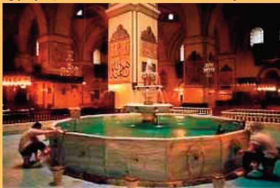
г. Оскес у Рурку (Osques, Rouergue)

струкцый і ідыёмаў, што робіць яе вельмі складанай для прачытання нават сучаснаму падрыхтаванаму даследчыку, не кажучы ўжо пра чалавека часоў высокага Сярэднявечча, бо вядома, што ў тыя часы карысталіся не класічнай, а так званай “народнай” лацінай. Гэтая праца потым была перапрацавана на аснове ўласнага вопыту аўтара і яго паплечнікаў у прапаведанні і палеміцы супраць ерэтыкоў. У выніку былі напісаны Opusculum contra hereticos et eorum errors і Liber contra Manichaeos . Але найбольш каштоўная інфармацыя пра гэтую даволі невялікую групу (дакладныя дадзеныя адсутнічаюць) зна-