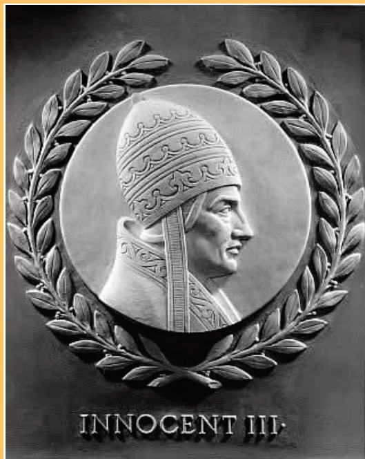
Манета з выявай Інакенція III

На мой погляд, датычна да Сярэднявечча варта ка-