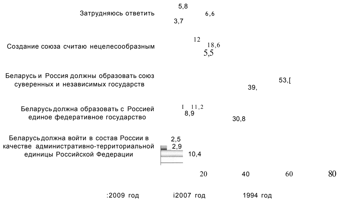
Диаграмма 3. Распределение мнений жителей Беларуси относительно формы союза Беларуси и России, в %, динамика по годам

Приведенные данные показывают, что большая часть жителей Беларуси выступает за создание Союзного государства по принципам организации Европейского Союза. Более того, число сторонников такой формы интеграции в период с 2007 по 2009 год значительно увеличилось. Наблюдаемая тенденция вполне объяснима. Здесь можно говорить о двух проблемных моментах. Во-первых, Программа мероприятий по созданию Союзного государства, принятая в 1999 году, практически не выполнялась. Во-вторых, именно в названный период времени отношения между двумя странами неоднократно обострялись. Связано это было с многократными торгово-экономическими конфликтами, например, так называемыми «нефтегазовой войной» (2007-2008 гг.) и «молочным кризисом» (2009 г.). Результаты опросов населения, экспертных интервью, контент-анализов СМИ показали, что в Беларуси негативно оценивается поведение российского руководства, его стремление оказывать возрастающее экономическое давление на Беларусь. Более того, некоторые российские высокопоставленные чиновники позволяли себе высказывания, недопустимые в отношении к народу не просто страны-партнера, а союзника и близкого друга. Примером таких высказываний может послужить заявление о «народе-нахлебнике», живущем за счет дотаций со стороны восточного соседа. Кстати, нечто подобное говорилось и об украинском народе.