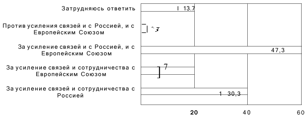
Диаграмма 4. Распределение ответов на вопрос «Если бы сегодня проходил референдум по выбору будущего пути развития вашей страны, как бы Вы проголосовали?», в %

События, составляющие содержательные характеристики этапов строительства Беларусью межгосударственных отношений с геополитическими соседями, были оценены в ходе исследования экспертами (политиками, политологами, журналистами, представлявшими как властные структуры, так и оппозицию) иначе, чем те, которые происходили на вторых этапах. Многими участниками глубинных интервью и фокусированных групп отмечалось то, что действия Беларуси можно оценить не как конъюнктурные, а достаточно искренние и прагматичные. Такой курс одобряется и большинством жителей республики. Обратимся к Диаграмме 4.