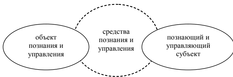
Рис. 2. Взаимодействие субъектов и объектов познания и управления в неклассической науке

воедино субъектов управляющих и субъектов управляемых . Выбор управленческих средств, форм, технологий оказывается зависимым не только от конкретных объективных условий, но и от субъектных параметров всех участников управленческих стратегий.