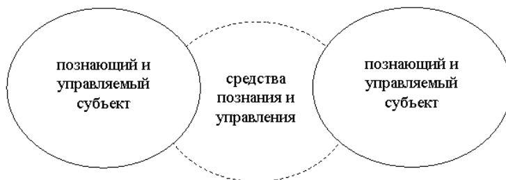
Рис. 3. Взаимодействие субъектов и объектов познания и управления в постнеклассической (современной) науке

Достаточно пространные экскурсы в социологическую терминологию не случайны, так как в ней отражается понятийно-категориальный аппарат социологии управления, знакомство с которым позволяет уяснить специфику социологического подхода к исследованию управления. Этот процесс, который изучает-