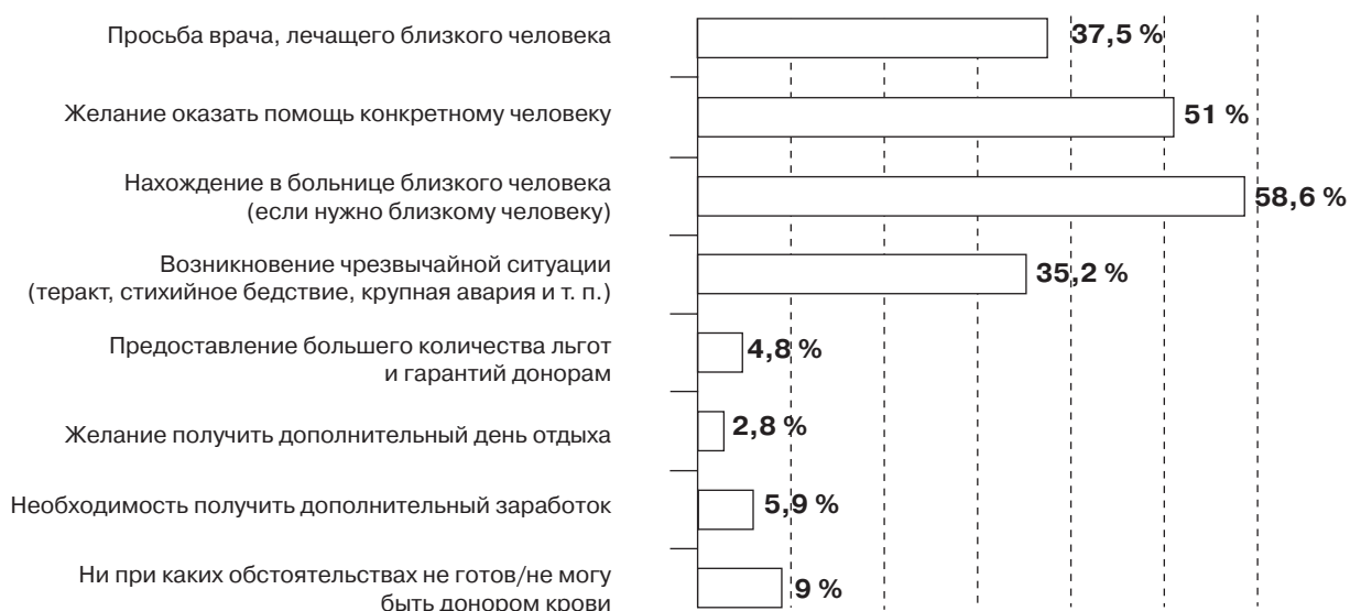
Рисунок 4 — Возможные побудительные мотивы участия в донорстве крови в группе людей, не имевших ранее такого желания

□ — в группе бывших доноров; ■ — в группе потенциальных первичных доноров