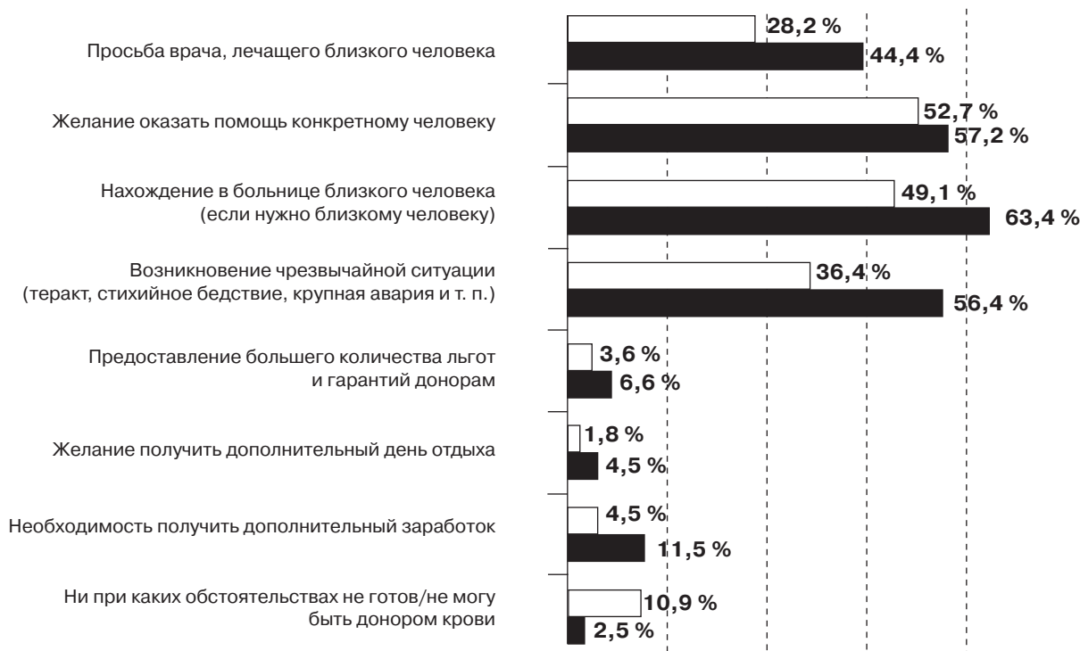
Рисунок 3 — Возможные побудительные мотивы участия в донорстве крови:

Группа, отрицательно отвечающая на вопрос о возникавшем когда-либо желании сдать кровь в качестве донора, хотя и велика, но она не является безнадежной с точки зрения возможностей привлечения в ряды доноров (рисунок 4).