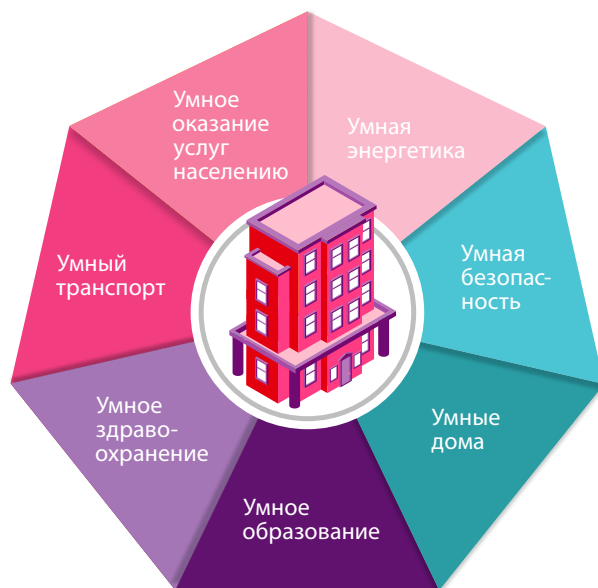
Рис. 1. Основные сферы деятельности «умного города» [4]