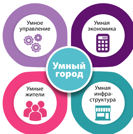
Рис. 2. Важнейшие составляющие «умного города» [1]

Великобритания. Милтон-Кинс получил smart-статус, когда Министерство предпринимательства, инноваций и ремесел в 2010 г. запустило здесь программу Catapult Transport Systems. В 2015 г. беспилотные двухместные машины, работающие на электричестве, впервые появились на улицах города. Они оборудованы 22 сенсорами, радаром, панорамными и стереокамерами, без подзарядки могут проехать 64 километра. Позже был запущен проект МК: Smart. Он собирает все данные о городе в одну систему: показания спутников, датчиков в почве и системах энерго- и водопотребления; информацию с камер видеонаблюдения с функцией распознавания; социальные и экономические показатели. Таким образом, гражданам могут самостоятельно контролировать расходы энергии и воды.