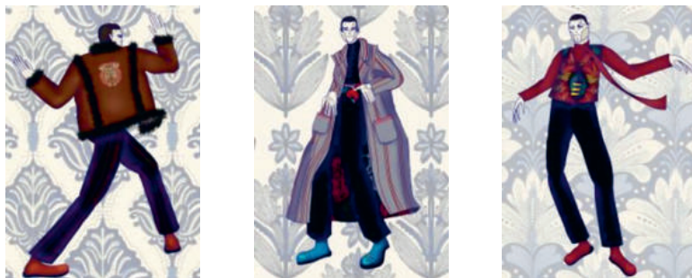
Рис. 3. Фрагмент эскизного ряда авторской коллекции мужской верхней одежды «Красная линия»