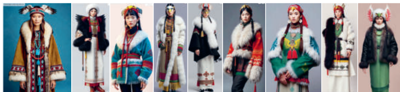
Рис. 6. Итоговые генерации изображений