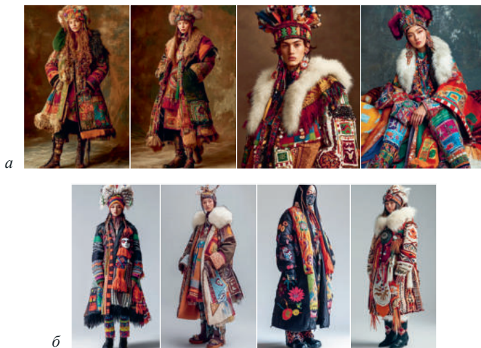
Рис. 4. Генерация изображений с помощью NeuromateAI (ChatGPT&Midjourney): а – запрос №1; б – запрос №2