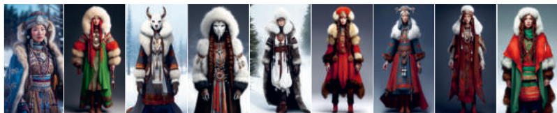
Рис. 5. Генерация изображений с помощью телеграмм-бот Kandinskiy