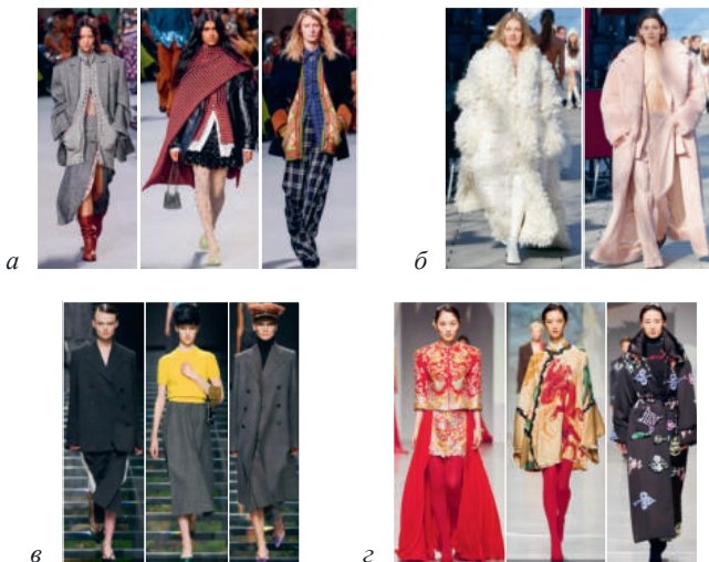
Рис. 3. Коллекции: а – P. Rabanne; б – Stella McCartney; в – Prada; з – Vivienne Tam