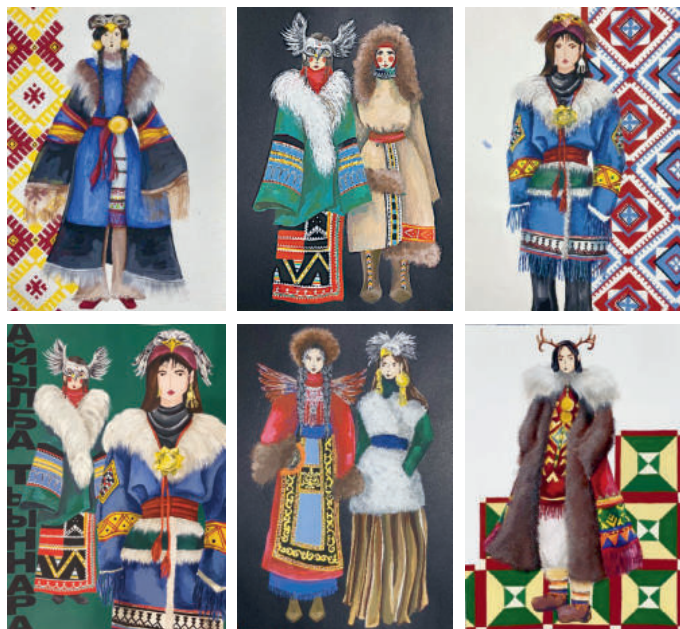
Рис. 7. Авторская эскизная коллекция Елены Гришиной