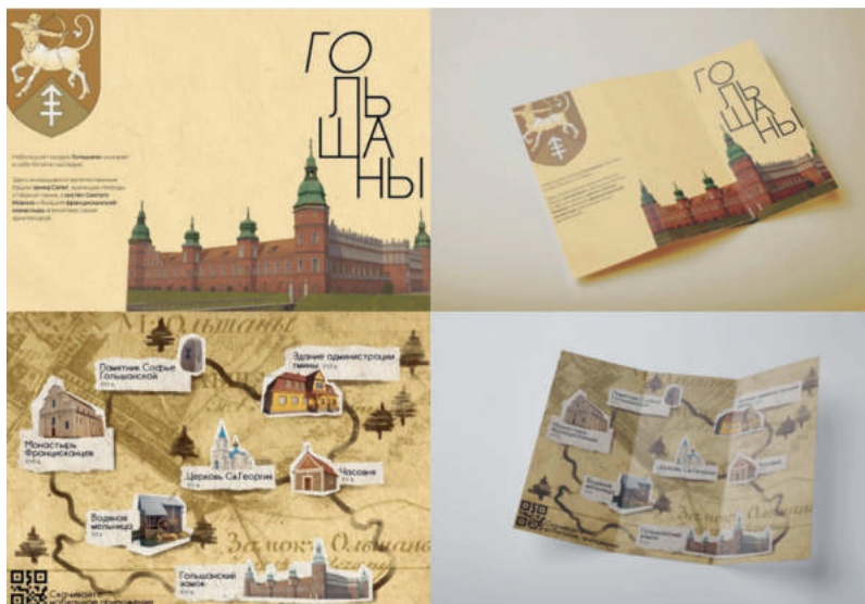
Рис. 3. Туристическая карта памятников историко-культурное наследия Республики Беларусь