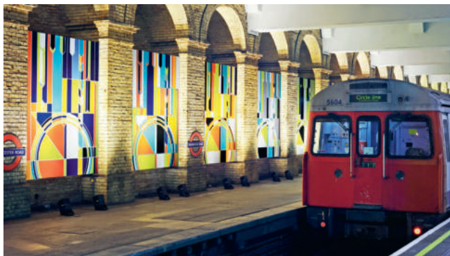
Рис. 1. Проект Лондонского метро «Art on the Underground»