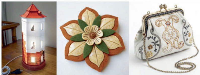
Рис. 4. Примеры мерча