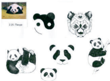
Рис. 2. Учебная работа по стилизации. Колледж НГУАДИ имени А. Д. Крячкова