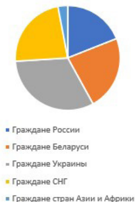
Нарушители границы в Республику Беларусь