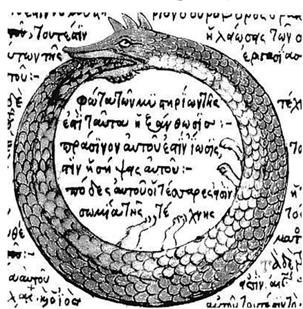
Рис. 1. Символ циклического движения в древних культурах Fig. 1. Symbol of cyclical movement in ancient cultures

Символом циклического движения во многих древних культурах выступает замкнутый круг в виде змеи, кусающей свой хвост (рис. 1).