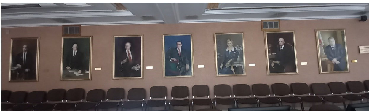
Рисунок 1 – Галерея ректоров в читальном зале библиотеки БГУКИ БГУКИ

Являясь структурным подразделением университета, библиотека Белорусского государственного университета культуры и искусств (далее – БГУКИ) также участвует в процессе формирования его корпоративного коммеморативного пространства. На территории библиотеки размещены Галерея портретов ректоров БГУКИ (читальный зал), выставка дипломных работ студентов кафедры декоративно-прикладного искусства (холл 2-го этажа), постоянно действующая выставка «Новые издания БГУКИ» (читальный зал).