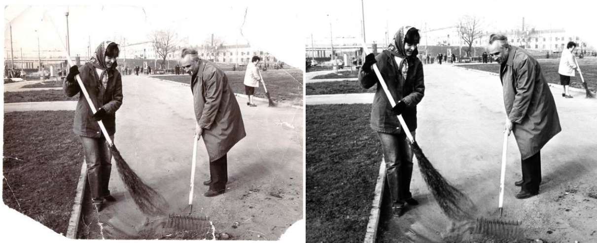
Рисунок 4 – Оцифровка и восстановление фотографий из семейного архива Беспалых [13]

а также с мест предыдущей работы. Многие из фотографий были специально оцифрованы и восстановлены для включения в издания.