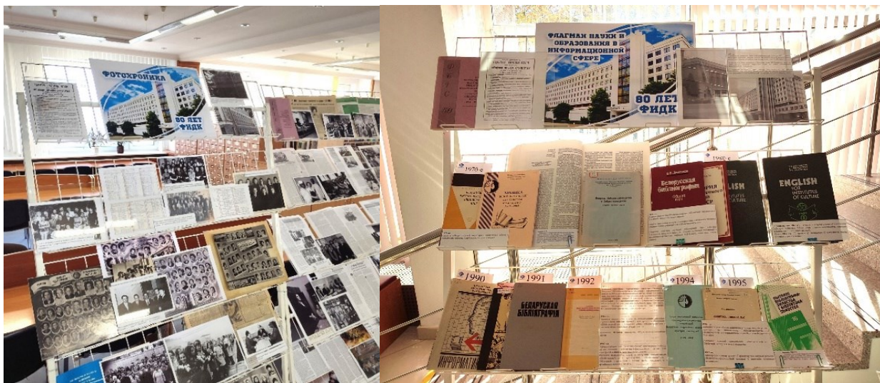
Рисунок 2 – Фрагменты экспозиций, приуроченных к 80-летию факультета информационно-документных коммуникаций БГУКИ

Целью создания указателей в первую очередь является продвижение результатов научной и образовательной деятельности университета. При этом выстроенные в четкой хронологии, имеющие достаточно широкие временные рамки (от 5 лет и более), такие библиографические пособия представляют собой информационный ресурс для изучения истории развития как университета в целом, так и отдельных научных школ, и конкретных дисциплин.