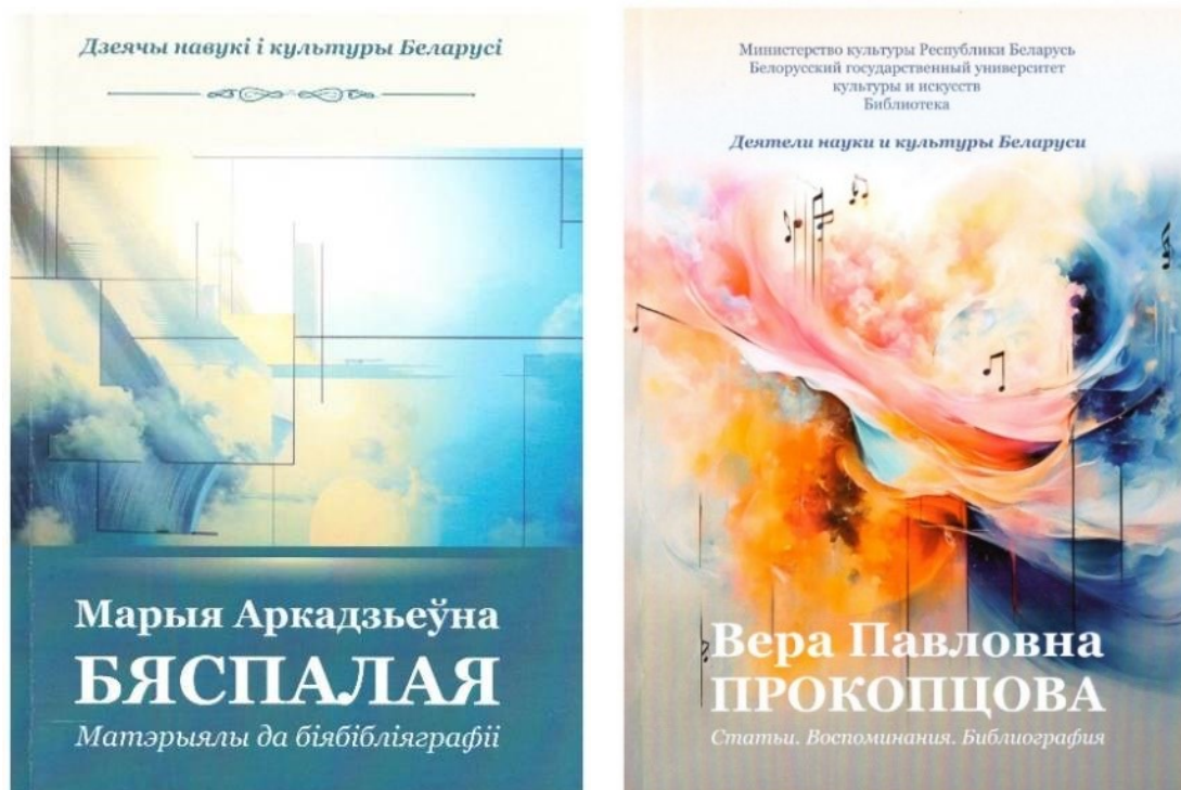
Рисунок 3 – Указатели, посвященные В. Прокопцовой [12] и М. А. Беспалой [13]

Мемориальный характер указателей во многом определил структуру и оформление изданий.