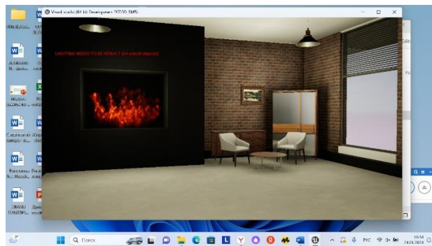
Рисунок 1 – Виртуальная педагогическая студия в локации “Кофейня”

Целью занятия явилось знакомство с историей и богатейшим потенциалом русского слова (на примере знакомства с сокровищницей литературы Тюменской области). В этой связи занятие рассчитано на широкую аудиторию: школьников, студентов, преподавателей, любителей русского слова.