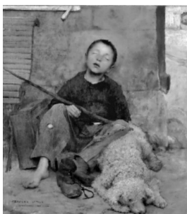
Ж. Бастьен-Лепаж «Слепой нищий»