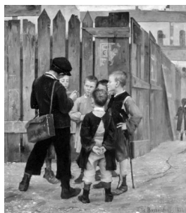
М. Башкирцева «Встреча». 1884 г.

В работах Марии Башкирцевой «Жан и Жак – дети приюта» (1883), «Встреча» (1884) и Жюля Бастьена-Лепаж «Нечего делать», «Бедняжка», «Слепой нищий», «По дороге в школу» прослеживается внимание к обездоленному детству, деталям при создании образов, способность передать характеры, вписанности персонажей в окружающую среду. Каждая из работ может стать иллюстрацией произведений знаменитых писателей означенного периода.