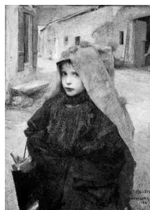
Ж. Бастьен-Лепаж «По дороге в школу»