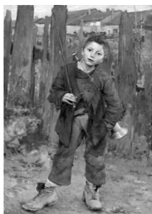
Ж. Бастьен-Лепаж «Нечего делать»