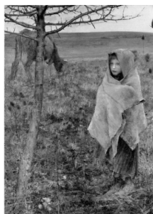
Ж. Бастьен-Лепаж «Бедняжка»