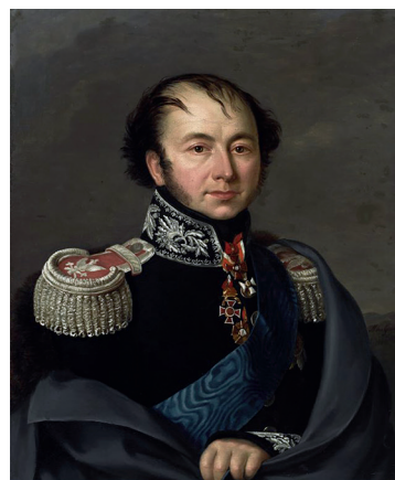
Рис. 1. Франциск-Ксаверий Друцкий-Любецкий (1778–1846). Портрет работы М. Э. Гомье. Масло. 1825. Национальный музей в Варшаве.

валерии Л. Л. Беннигсена (1745–1826) 18 , поэтому ему и доверили временное управление текущими губернскими делами.