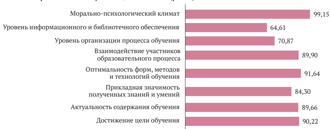
Рис. 1. Оценка респондентами показателей эффективности курсов повышения квалификации, % Fig. 1. Respondents' assessment of the effectiveness of advanced training courses, %