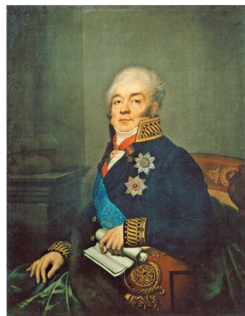
Рис. 7. Граф (с 1819 г.) Дмитрий Александрович Гурьев (1758–1825). Портрет работы Я. Ромбауера. Масло. 1818. Государственная Третьяковская галерея.