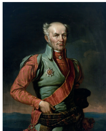
Рис. 6. Войцех Пусловский (1762–1833). Портрет работы В. В. Ваньковича. Масло. 1820–1840. Литовский художественный музей.

Свою деятельность ГКВП начал в мае 1813 г., когда К. Ф. Друцкий-Любецкий уже находился в Княжестве Варшавском. Полномочия комитета первоначально распространялись на Виленскую и Гродненскую губернии, позднее – и на Минскую губернию и Белостокскую область. С возобновлением деятельности ГКВП функции люстрационных комиссий были переданы восстановленным поветовым и губернским присутствиям этого комитета.