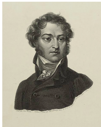
Рис. 2. Александр Степанович Лавинский (1776–1844). Гравюра М. Д. Подолинского по портрету Я. Рустема. 1813.

Виленская губернская исполнительная комиссия состояла из трех отделов: продовольственного отдела; отдела, занимающегося внутренним управлением (до 25 декабря 1812 г., с 30 декабря эти функции были переданы восстановленному Виленскому губернскому правлению); финансового отдела. Члены исполнительной комиссии выполняли различные предписания начальства, а также решали вопросы «подчиненных ей мест» – городских дум, магистратов и земских повестовых начальников.