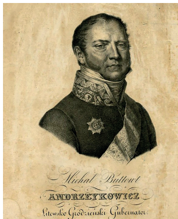
Рис. 3. Михаил Фаддеевич Бутовт-Анджейкович (1778–1830). Гравюра неизвестного автора. 1813–1819.