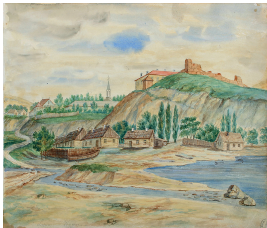
Рис. 8. Городно (Гродно). Старый замок. Художник Н. Орда. 1861–1869. Национальный музей в Кракове.

что в оной каморе находится оружие, но в неизвестном количестве» (рис. 8) 89 . По этой причине 8 апреля 1813 г. комендант «приказал отбить двери и нашел в оном оружия, дул ружейных, тесаков, гранат и разного лому», о чем представил ведомость 90 .