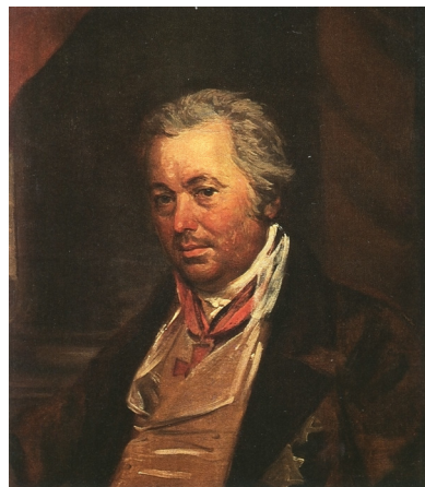
Рис. 5. Александр Михайлович Римский-Корсаков (1753–1840). Портрет работы А. Г. Варнека. Масло. Конец 1820-х гг. Государственная Третьяковская галерея. Источник: Турчин В. С. Александр Григорьевич Варнек, 1782–1843. М. : Искусство, 1985. С. 84

ни находились в лазаретах). После изгнания Великой армии российские войска распустили эти лазареты, и мобилизованные изъявили желание «возвратиться в места своего рождения» 61 .