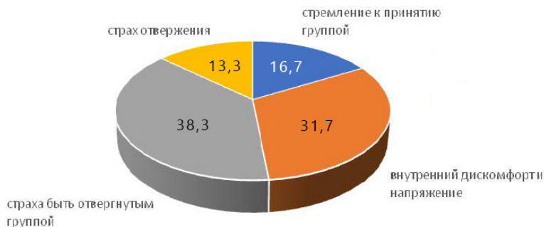
Рис. 3. Процентное распределение студентов по выраженности мотивации аффилиации, %

ладание «Страх быть отвергнутым группой» (23 чел. – 38,3 %), на втором месте по распространенности – «Внутренний дискомфорт и напряжение» (19 чел. – 31,7 %), на третьем месте – «Стремление к принятию группой» (10 чел. – 16,7 %) и на последнем месте – «Страх отвержения» (8 чел. – 13,3 %) (рис. 3).