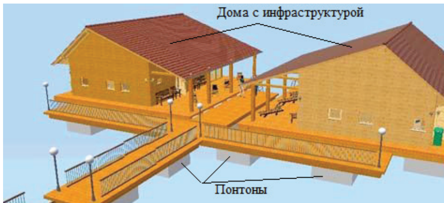
Рис. 2. Макет комплекса

Постройка комплекса будет осуществляться на бетонных понтонах, так как технология строительства с их использованием позволяет с наибольшей экономичностью осуществить проект и построить комплекс на воде из нескольких домов (рис. 2). Схема комплекса представлена на рис. 3.