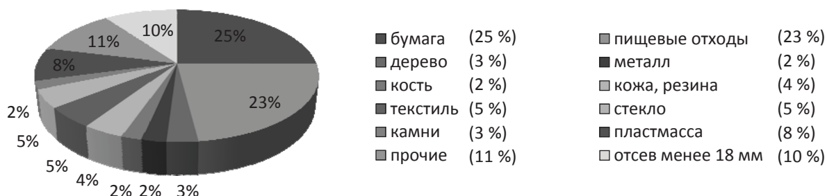
Рис. 2. Морфологический состав ТБО

Для внедрения схемы вывоза отходов предложением предусматривается: осуществить в 2010–2015 годах строительство и ввод в эксплуатацию объекта «Механико-биологическая установка по обработке 110 тыс. тонн в год твердых бытовых отходов в г. Минске» (далее – мусороперерабатывающий завод) и объектов инженерной и транспортной инфраструктуры к нему, обеспечив в I квартале 2013 г. ввод в эксплуатацию мусороперерабатывающего завода.