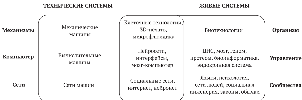
Рис. 2. Направления использования конвергентных технологий Fig. 2. Direction for using convergent technologies

Другая точка зрения проблемы природы человека в техном мире основана на том, что если будущие достижения биологии смогут изменить разум, то это приведет к исчезновению самого человека. Унич-