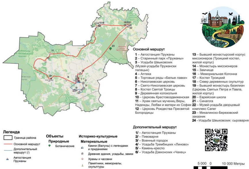
Рис. 3. Картограмма туристических маршрутов Пружанского района

Проанализировав туристский потенциал Пружанского района, заключительным этапом стало создание в районе туристического маршрута (рис. 3).