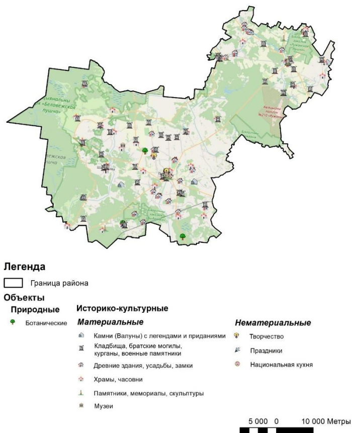
Рис. 1. Картограмма объектов-показа Пружанского района (составлено по [3, 4])