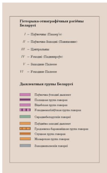
Рис. 2. Легенда диалектической карты «Групоўка гаворак на тэрыторыі Беларусі» (сост. авт.)

Для составления карты «Гаворкі і дыялекты Беларусі» использована нормальная равноугольная коническая проекция. По территориальному охвату карта отражает исключительно границы Республики Беларусь. По виду компоновки на конкретной тематической карте масштаб не отображается, легенда и название карты отображены на полях карты (рис. 2).