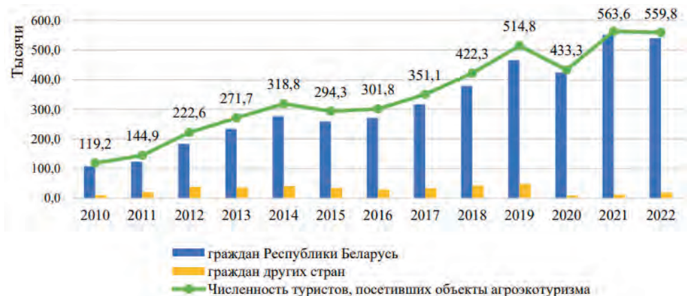
Рис 1. Численность туристов, посетивших объекты агротуризма, 2010—2022 гг., тыс. человек

За годы развития сельский туризм продемонстрировал невероятный рост. На начало 2023 г. на территории республики работало более 3 тыс. агроусадеб, в которых отдыхало около 500 тыс. туристов (по данным табл. и рис. 1). Основная доля туристов приходится на жителей нашей страны (более 80 %), затем следуют Россия, Латвия, Литва и другие.