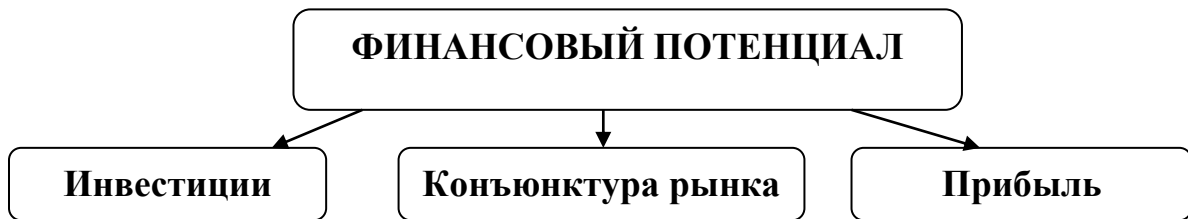
Рис. 1. Структура финансового потенциала сельскохозяйственных организаций

цитности ресурсов за счет как собственных источников, так и привлеченных. Способность организации привлечь ресурсы со стороны определяет его инновационно-инвестиционную привлекательность, а объем привлеченных ресурсов формирует финансовый потенциал хозяйствующего субъекта. Нарращивание финансового потенциала за счет модернизации инвестиционных средств в ресурсы, требующие трансформации, соответственно, обеспечивает рост прибыли и производственного потенциала организаций.