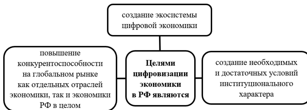
Рис. 1. Триединая цель цифровизации экономики в России

В России задачи цифровизации экономики направлены на достижение триединой цели, представленной на рис. 1.