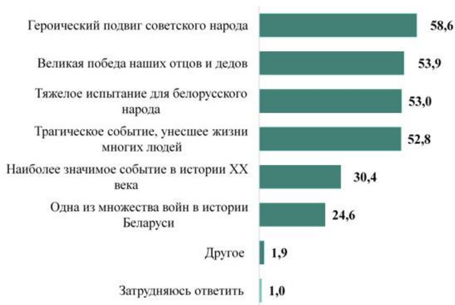
Рисунок 2.2 – Общественное мнение о событиях Великой Отечественной войны [68]

На примере сохранения исторической памяти о войне можно наблюдать, как государство осуществляет политику в соответствии с коллективной памятью народа. По данным опроса Института социологии НАН Беларуси, для большинства белорусов (58,6% жителей нашей республики) Великая Отечественная война – это в первую очередь героический подвиг советского народа (см. рисунок 2.2) [69]. Более 90% белорусов считают Великую Отечественную войну одним из самых важных событий в истории нашей страны.