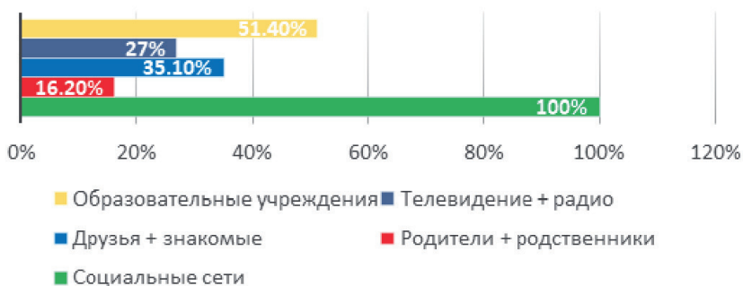
Рис. 2. Распределение ответов об источниках информации о состоянии окружающей среды.

Как видно из полученных данных, практически у всех опрошенных основным источником информации являются социальные сети – 100 % ответов, образовательные учреждения – 51 %, друзья и знакомые – 35 %, телевидение – 27 % и наименьшим источником информации по экологической тематике являются родители. Такое распределение ответов позволяет констатировать, что для развития экологической культуры следует усиливать экологическую составляющую различных дисциплин при осуществлении образовательного процесса. Опасность получения информации из социальных сетей может быть обусловлена тем, что размещаемые материалы не рецензируются и могут содержать недостоверную информацию или информацию, продвигаемую для получения определенной выгоды заинтересованными сторонами.