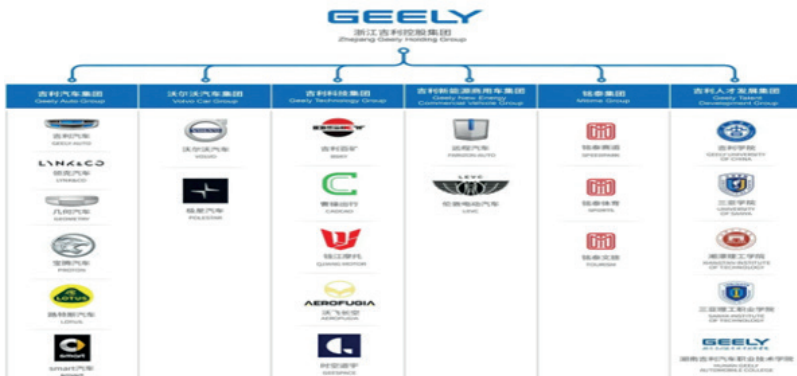
Рис. 3. Структура компании Geely Holding Group [6]

В настоящее время Geely принадлежат ряд автомобильных заводов и предприятий по производству трансмиссий и двигателей на территории Китая и за рубежом, а также научно-исследовательские центры в Китае, Швеции, Англии и Германии, дизайн-бюро в Шанхае, Гётеборге, Барселоне, Калифорнии и т. д. Geely Auto, Volvo Car Corporation, Drivetrain Systems International (DSI) – один из крупнейших мировых производителей трансмиссий, London Taxi – производитель знаменитых лондонских кэбов. На зарубежных рынках интересы Geely Holding Group представляет компания Geely International Corporation. Производственные мощности Geely Holding Group представлены 18 заводами, 9 из которых расположены на зарубежных рынках. Дилерская сеть бренда Geely насчитывает около тысячи автосалонов и сервисных станций на территории Китая, представляющих своим клиентам обслуживание в режиме 24/7 и занимающих первое место в Китае по удовлетворенности клиентов. Структура компании Geely Holding Group представлена на рисунке 3.