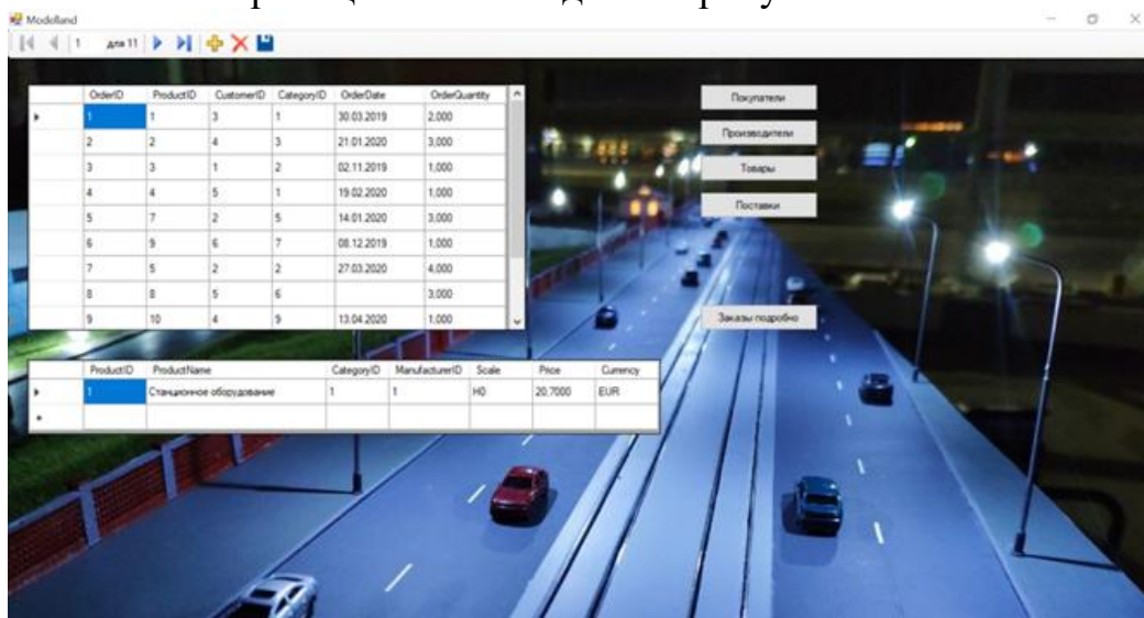
Рис. 4. Интерфейс главной страницы разработанного приложения

С помощью MS Visual Studio был создан интерфейс клиентской части ИС. Разработанное приложение помимо главной страницы имеет еще 6 страниц, которые содержат остальные таблицы разработанной базы данных и предоставляют пользователю необходимую информацию. Интерфейс главной страницы можно видеть на рисунке 4.