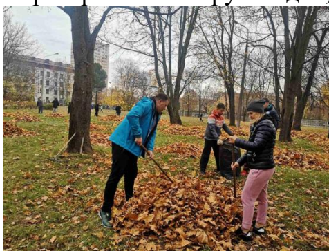
Рисунок 4. – Акция «Неделя чистоты» на историческом факультете

Трудотерапия совместно с преподавательским составом не только развивает трудолюбие и физическую активность, но и совершенствует умения работать в одном коллективе. Акция «Неделя чистоты» по благоустройству территории факультета собрала студентов всех курсов – совместная работа облагораживает не только пространство вокруг людей, но и душу! (рисунок 4).