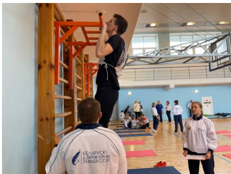
Рисунок 3. – Сдача нормативов ГФОК студентами в БГУ (2022 г.)

Студенты приняли участие в сдаче нормативов Государственного физкультурно-оздоровительного комплекса Республики Беларусь (ГФОК), целью которого является развитие физической культуры и спорта, оздоровление и физическое воспитание населения, формирование здорового образа жизни. (рисунок 3).