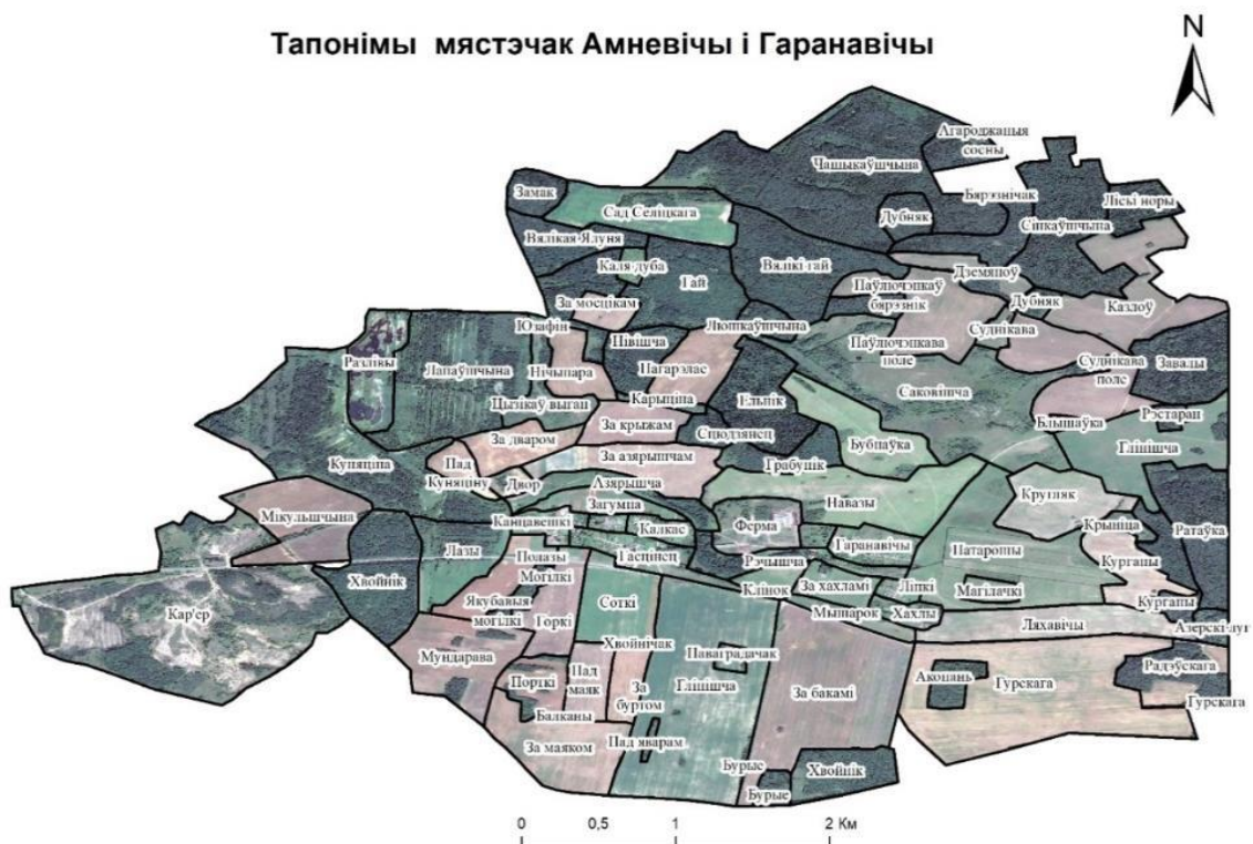
Рыс. 1. Тапонімы мястэчак Амневічы і Гаранавічы