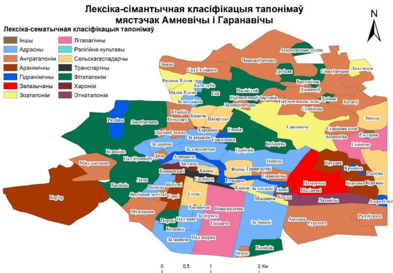
Рыс. 3. Лексіка-сімантычная класіфікацыя тапонімаў мястэчак Амневічы і Гаранавічы

З дапамогай ГІС-тэхналогій была створана картасхема лексіка-семантычнай класіфікацыі групы тапонімаў мястэчак Амневічы і Гаранавічы (рысунак 3).