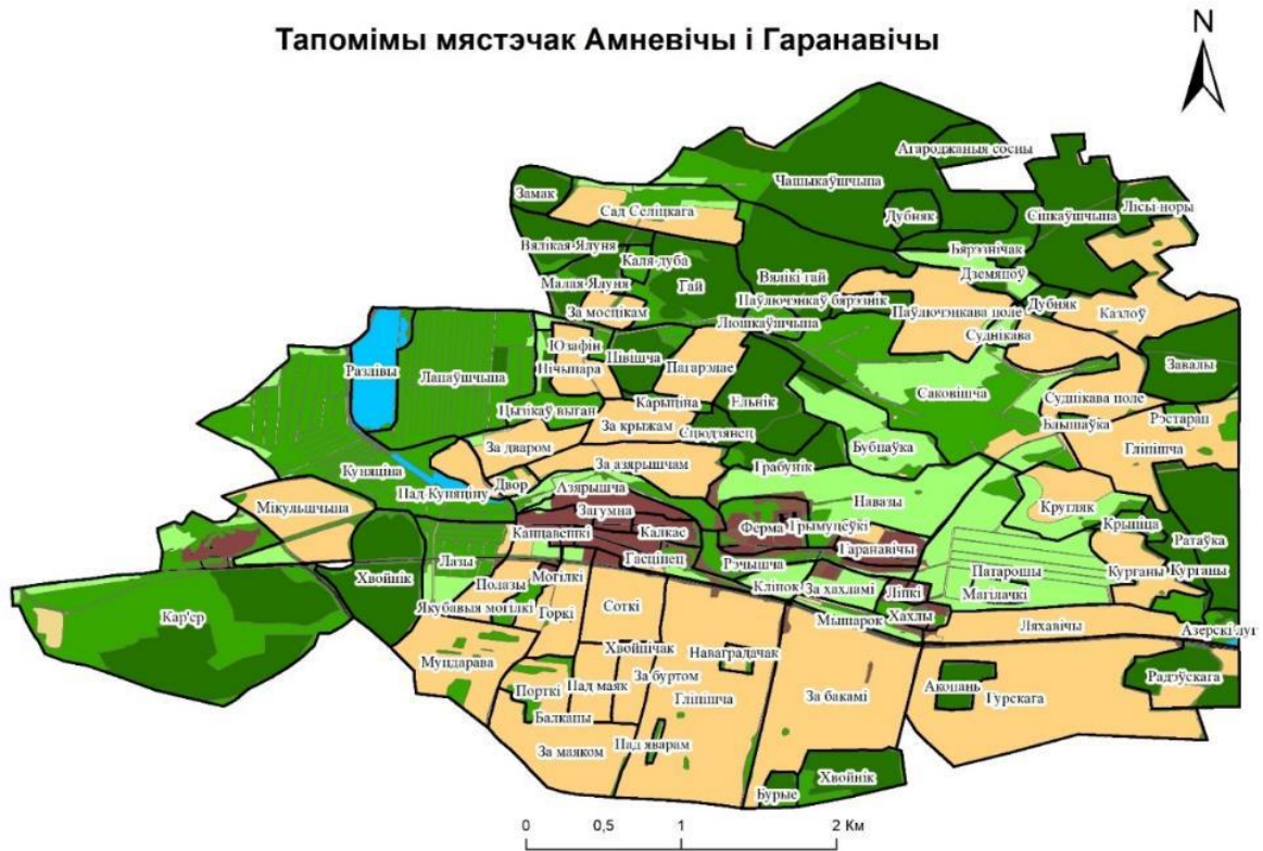
Рыс. 2. Тапонімы мястэчак Амневічы і Гаранавічы