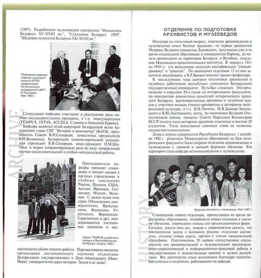
Рис. 3. Буклет кафедры источниковедения (продолжение)

Одним из первых достижений кафедры в это время можно назвать издание книги «Методология исторического исследования (механизм творчества историка)» [3]. Оно посвящено проблеме углубления исторического познания. В нем рассмотрены общелогические и общенаучные методы и их место в историческом исследовании; особое внимание уделяется историческому и логическому методам, методу восхождения от конкретного к абстрактному и восхождения от абстрактного к конкретному, методу моделирования исторических явлений и процессов. Подробно рассматриваются специальные исторические методы (историко-генетический, сравнительный, типологический, системный, диахронический, историческая ретроспекция). Рассмотрены также математико-статистические методы и информационные технологии, методы психоистории, методы понимания текста, семиотика, использование знаковых систем и искусствоведческий анализ.