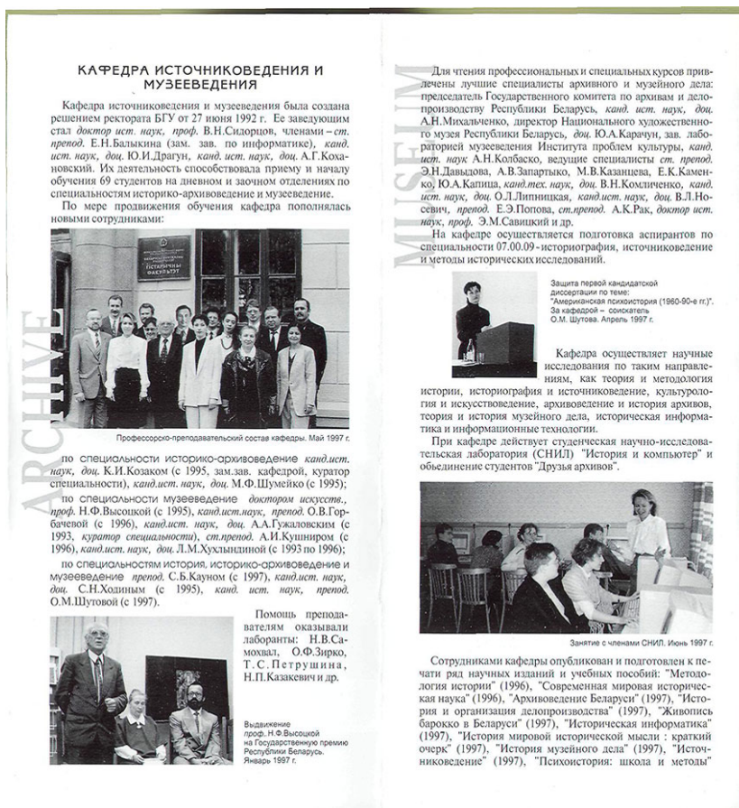
Рис.2. Буклет кафедры источниковедения

На следующей странице мы видим фото Манфреда Таллера, посетившего нашу кафедру. Это профессор Геттингенского университета, который курировал проект, по которому мы развивались в области исторической информатики, познакомились с различными мировыми достижениями в этой области. На следующем фото – посещение Кембриджа в Великобритании, где проходил обмен опытом.