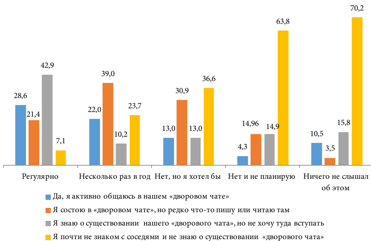
Рис. 2 Участие в преобразовании дворовой территории (2020 г.), % Figure 2. Participation in the transformation of the courtyard area (2020), %