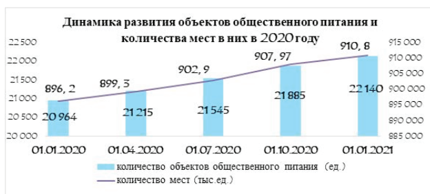
Рисунок 2 — Динамика развития объектов общественного питания и количества мест в них в 2020 году.

Несмотря на распространение COVID-19 согласно показателям Торгового реестра по состоянию на 1 января 2021 г. в стране осуществляли свою деятельность 22 140 объектов общественного питания (включая летние (сезонные) кафе, заготовочные объекты (цеха), магазины (отделы) кулинарии и другие) на 910 800 мест, что на 1 176 объектов или 5,6% и на 14 600 мест или 1,63 % больше по сравнению с 1 января 2020 г. (рисунок 2).