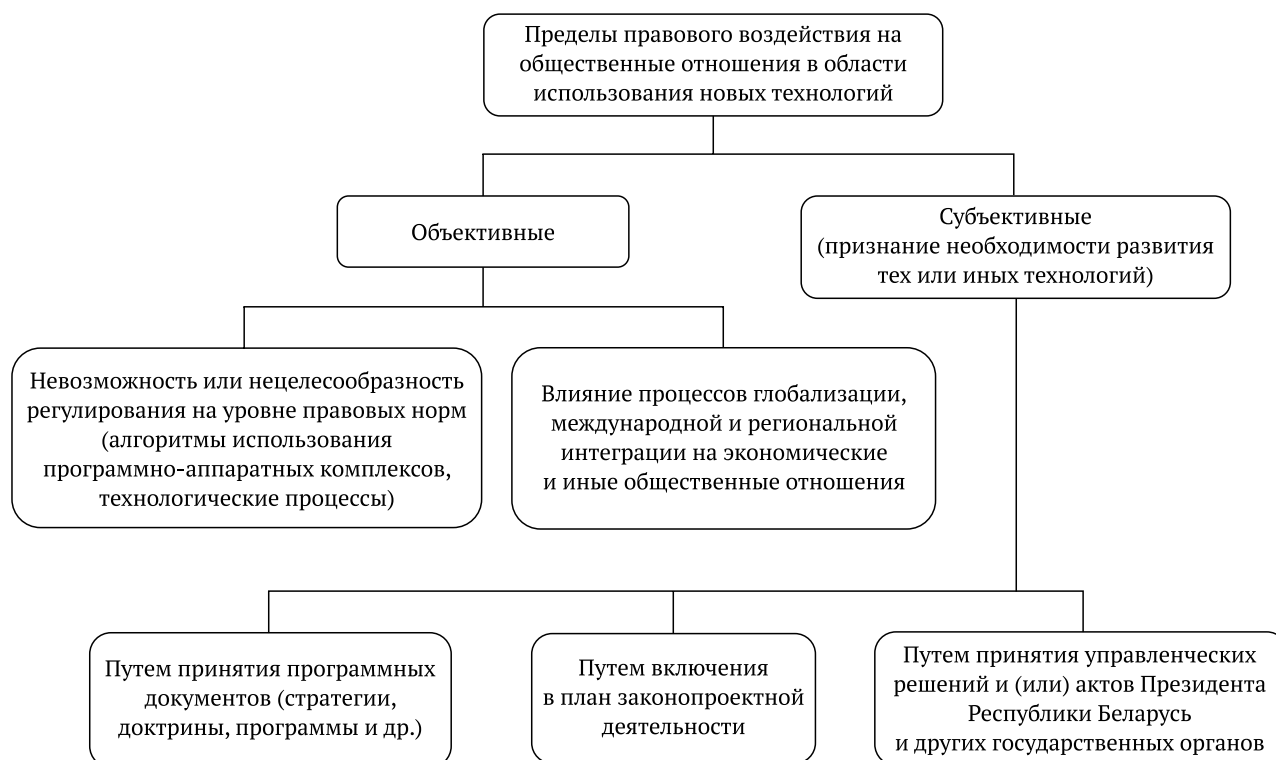
Рис. 3. Пределы правового воздействия на общественные отношения в области использования новых технологий

Таким образом, степень правового воздействия на общественные отношения в области использования новых технологий имеет объективные и субъективные пределы (рис. 3). Сказанное актуализирует необходимость обеспечения допустимого, необходимого и достаточного воздействия права на исследуемые отношения. Выявление пределов такого воздействия является важным условием эффективного правового регулирования всего спектра общественных отношений, складывающихся в связи с развитием новых технологий, и имеет существенную специфику в различных областях.