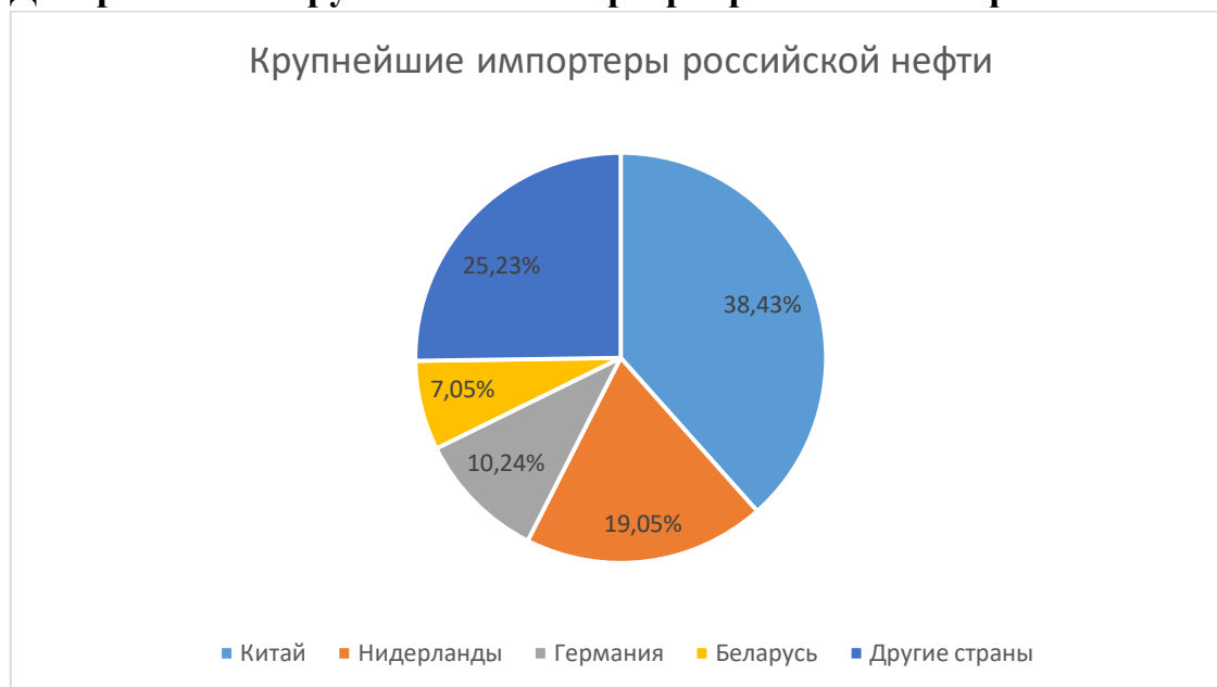
Диаграмма 3.3 Крупнейшие импортеры российской нефти 2021 г.

Последствия глобальной пандемии 2020 г. привели к уменьшению спроса на энергоресурсы в мире. Однако это в меньшей степени повлияло на энергетическое сотрудничество между Россией и Китаем: осуществлялись плановые проекты в нефтегазовом направлении, увеличивались поставки российских энергоресурсов в КНР [83, 125]. С 2017 г. С 2017 года крупнейшим покупателем российской нефти является Китай. В 2021 году эта страна закупила в России 70,1 млн тонн этого ресурса (30,6% от общего объема его российского экспорта) на сумму в $34,9 млрд.