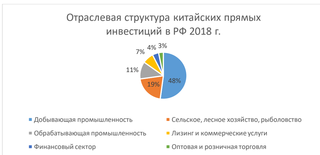
Диаграмма 3.1 Отраслевая структура китайских прямых инвестиций в РФ в 2018 г.