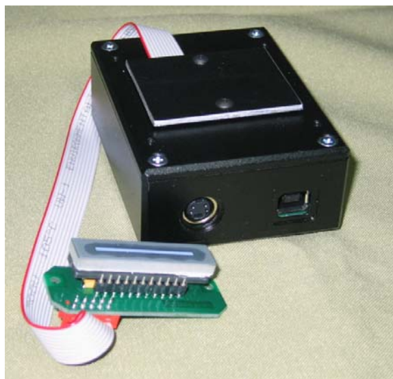
Рис. 2. Внешний вид камеры

Камера может работать без синхронизации, а также синхронизироваться импульсами от других приборов, вырабатывать импульсы для запуска внешних приборов. В тех случаях, когда экспериментальная установка обладает высоким уровнем помех, импульсы запуска передаются по оптоволоконным линиям связи. Внешний вид камеры показан на рис. 2.