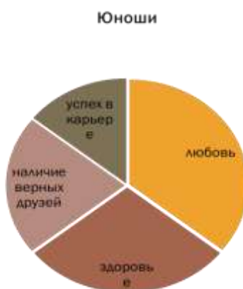
Рисунок 3. Результаты анкеты «Изучение ценностных ориентаций людей» (понимание личного счастья юношами)

Юноши понимают Личное счастье по-другому (рисунок 3): на 1-м месте – любовь, на 2-м месте – здоровье, на 3-м месте – наличие верных друзей, на 4-м месте – успех в карьере.