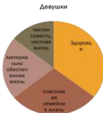
Рисунок 2. Результаты анкеты «Изучение ценностных ориентаций людей» (понимания личного счастья девушками)

Исходя из результатов анкеты (рисунок 2) среди выбранных слов для понимания девушками личного счастья были: на 1-м месте – здоровье (психическое и физическое), на 2-м месте – наличие детей, счастливая семейная жизнь, на 3-м месте – материально обеспеченная жизнь, на 4-м месте – чистая совесть, честная жизнь.