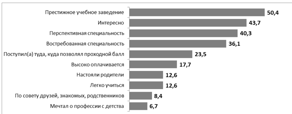
Рисунок 2 – Критерии выбора учебного заведения

Таким образом, полученные результаты исследования позволили зафиксировать многогранный, нестандартный, достаточно специфический и даже противоречивый портрет современной студенческой молодежи. Несмотря на различные характеристики рассматриваемого поколения, молодежь имеет четкие представления о жизненных целях, успешности и факторах ее достижения, прекрасно очерчивает жизненные ориентиры, описывает составляющие профессионализма. Среди наиболее значимых направлений рассматривается собственное профессиональное развитие, включающее различные формы получения знаний: от традиционных до цифровых.