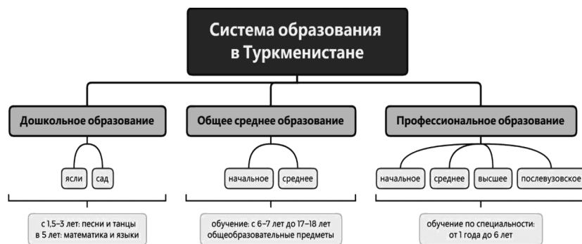
Рисунок 1. — Ступени образования в Туркменистане

В системах образования Беларуси и Туркменистана есть много общего. Среднее образование можно получить в общеобразовательной школе, лицее и гимназии. Учебный год в нашей стране начинается 1 сентября и заканчивается в конце мая. Как и белорусы, многие туркмены стремятся получить