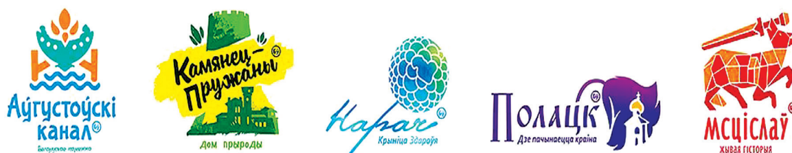
Рис. 3. Логотипы пилотных территорий, разработанные в рамках реализации проекта «Поддержка устойчивого развития туризма в Беларуси»