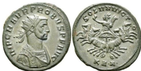
Мал. 8. Срэбная манета імператара Проба. (RIC. V. II. Probus. №. 101) Fig. 8. Silver coin of the Emperor Probus

Сонечная калясніца Sol Invictus прадстаўлена на манетах рымскага імператара Проба з легендай Soli Invicto (RIC V. II. Probus. №№. 101, 202–208) [16, с. 29, 39] (мал. 8). На гэтых манетах бачны малады бог у прамяністай кароне, які кіруе калясніцай запрэжанай чатырма канямі. У гэтым выпадку можна ўбачыць падабенства іканаграфіі Sol Invictus і пальмірскага Малакбела. Малакбел ў салярным аспекце – гэта ўзброены ваяр. На манетах імператара Аўрэліяна Sol Invictus таксама носіць ваяўнічы характар [17, с. 435–436]. Абодва багі маюць салярны і мілітарны аспекты, якія звязаны адзін з адным, што, у сваю чаргу, збліжае іканаграфіі гэтых салярных багоў.