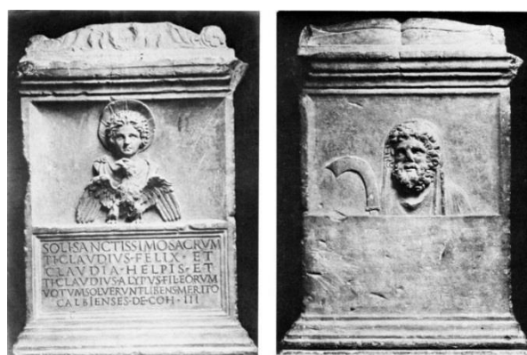
Мал. 6. Алтар у гонар Малакбела і пальмірскіх багоў. Рым

Цяпер варта закрануць пытанне сувязі іканаграфіі Малакбела і Sol Invictus. Імператар Аўрэліян, які аднавіў еднасць Рымскай імперыі, падавіўшы выступленні сепаратысцкіх