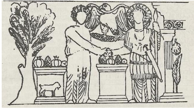
Мал. 1. Рэльеф Малакбела і Аглібола з храма Бела ў Пальміры Fig. 1. Relief of Malakbel and Aglibol in the temple of Bel in Palmyra

Як бог расліннасці Малакбел шанаваяся разам з Агліболам, які быў богам месяца ў пальмірскім пантэоне. Абодва багі часта фігуруюць разам на помніках сакральнага мастацтва Пальміры, а мясцовых надпісы надаюць ім эпітэт “святых браты” [2, с. 34–35; 7]. Яскравым прыкладам сумеснага шанавання гэтых багоў з’яўляецца рэльеф з храма вярхоўнага бога Бела [2, с. 152; 7] (мал. 1). На гэтым рэльефе прысутнічае выява Малакбела і Аглібола, якія стаяць разам у атачэнні кіпарыса і алтароў з пладамі зямлі, а над імі лунае арол са змяёй у дзюбе. Аглібол мае прамяністы німб і паўмесяц на плячах, а бог без німбу – гэта выява Малакбела, бо за ім стаіць кіпарыс, які лічыўся ў пальмірскіх вераваннях свяшчэнным дрэвам гэтага бога [3, с. 159–160]. Кіпарыс часта фігуруе з Малакбелам на пальмірскіх тэсерах і асацыюецца з яго функцыяй бога расліннасці [6]. На гэтым рэльефе Аглібол мае яскравы вайсковы аспект, бо ён трымае дзіду і носіць меч, а бог расліннасці Малакбел апрануты ў сялянскую вопратку [7; 8, с. 86–103].