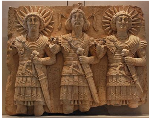
Мал. 3. Рэльеф пальмірскай трыяды вярхоўных багоў. Луўр. Парыж Fig. 3. Relief of the triad of the Palmyrian gods. Paris