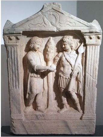
Мал. 2. Рэльеф Малакбела і Аглібола. Рым Fig. 2. Palazzo dei Conservatori. Relief of Malakbel and Aglibol. Rome

лідарстве Аглібола. У саюзе двух багоў, магчыма, ён выступаў як старэйшы брат. На думку А. Сейрыга і Я. Вайса, бог месяца часта з'яўляўся старэйшым братам бога расліннасці і сонца ў міфалогіі народаў блізкага Ўсходу [6; 7]. Арыгінальна выглядае сцэна прымірэння двух пальмірскіх багоў на рэльефе з Хірбет-Рамадана ў Сірыі [2, с. 153; 7]. На гэтым рэльефе Аглібол і Малакбел зноў паціскаюць адзін аднаму рукі, але апошні ўжо мае прамяністы німб. Таму гэтая выява яскрава дэманструе пальмірскага бога ў саяярным аспекце, хаця ён застаецца спадарожнікам бога месяца. Магчыма, два аспекты Малакбела як бога расліннасці і бога сонца маглі мець цесную сувязь і не супярэчылі адзін аднаму ў сістэме пальмірскіх вераванняў, хаця саяярны аспект пальмірскага бога мусіў з'явіцца пазней [7; 9].