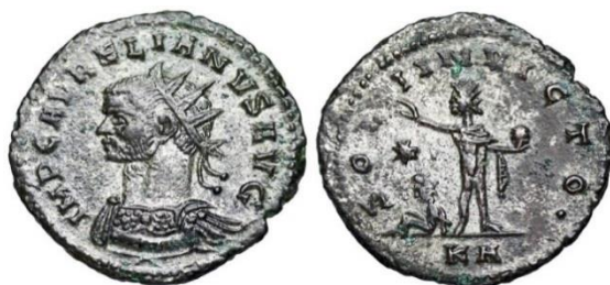
Мал. 7. Срэбная манета імператара Аўрэліяна. (RIC V. I. Aurelian. №. 54). Fig. 7. Silver coin of the Emperor Aurelian

утварэнняў (Пальмірскага царства і Гальскай імперыі), увёў дзяржаўны культ салярнага бога (Scriptores Historiae Augustae – Гісторыя Аўгустаў. SHA Aurel. XXV, 4–6) [13, с. 286–304; 14, с. 82–83]. Нумізматычны матэрыял дазваляе казаць пра асноўныя рысы іканаграфіі Sol Invictus. На манетах рымскага імператара Аўрэліяна можна заўважыць выявы салярнага бога ў выглядзе маладога мужчыны, які мае прамяністы німб або карону (Roman Imperial Coinage Рымская імперская чаканка. RIC V. I. Aurelian №№. 6, 17, 54, 61–67, 77–78, 134–137, 154, 157, 248–257) [15, с. 265–294]. Менавіта ў такім вобразе бог Sol Invictus набліжаецца да Малакбела (мал. 7). Выявы Sol Invictus і Малакбела ў салярным аспекце амаль супадаюць. Абодва багі выступаюць як маладыя мужчыны з прамяністам німба і могуць кіраваць сонечнай калясніцай.