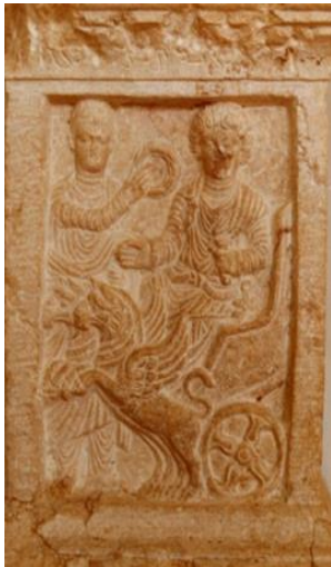
Мал. 4. Рэльеф Малакбела з храма Баалшаміна ў Пальміры Fig. 4. Relief of Malakbel from the Temple of Baalshamin.

Салярны аспект Малакбела заўважны на пальмірскім рэльефе з калекцыі Луўра (мал. 3) [2, с. 147], дзе гэты бог мае прамяністы німб і стаіць разам з Баалшамінам і Агліболам [1, с. 31–32]. Адметна тое, што Малакбел ужо мае мілітарны аспект, бо ён у рымскай вайскавай форме і трымае меч. Аглібол таксама ўзброены і мае прамяністы німб з паўмесяцам. Як бог сонца, але без прамяністага німбу, Малакбел фігуруе на рэльефе алтара з храма Баалшаміна (мал. 4). На дадзенай выяве можна ўбачыць маладога бога, які сядзіць у запрэжанай грыфонамі сонечнай калясніцы. Грыфон часта прысутнічае разам з Малакбелам на розных выявах, на якіх яскрава праяўляецца сонечны аспект гэтага бога [7].