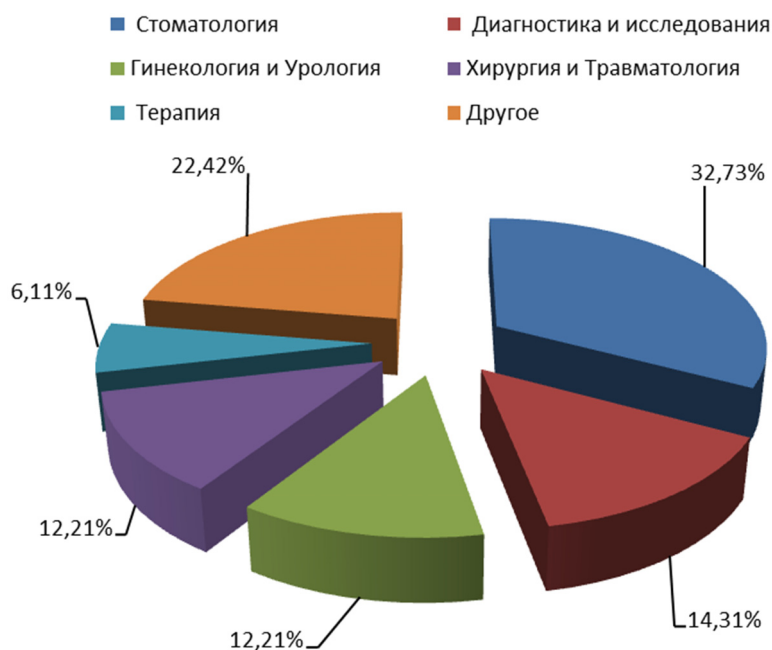
Рис. 4. Структура наиболее востребованных платных медицинских услуг в России за 2018–2019 гг.

Рассмотрим на рис. 4 структуру наиболее востребованных платных медицинских услуг в России за 2018–2019 гг., используя статистические данные [3].