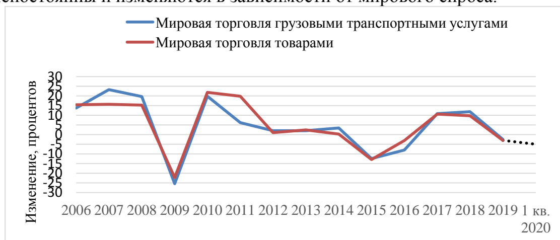
Рисунок 2 – Динамика мирового экспорта грузовых транспортных услуг и мировой торговли товарами в 2006 – 2019 гг., 1 кв. 2020 г. (по отношению к прошлому году), процентов

Изменения в мировой торговле. Ориентировочно половина мировой торговли транспортными услугами сопровождается торговлей конечными товарами и сырьем. В данной связи транспортный сектор в значительной степени зависит от колебаний торговых потоков, что подтверждается данными рисунка 2. Тарифы на грузовые перевозки непостоянны и изменяются в зависимости от мирового спроса.