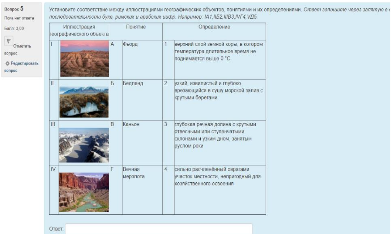
Рисунок 3 – Пример задания III уровня

В заданиях IV уровня использовались задания на соответствие, но с неравным числом элементов. Также были использованы задания, предусматривающие работу «Облаком слов» (рисунок 4). Основной составления облака слов является подбор ключевых слов и сочетаний по определенной теме. При отборе ключевых слов в основе лежит принцип смысла. Учащимся в условии задания в качестве примера предлагается варианта ответа, опираясь на который, они должны выбрать соответствующие слова/словосочетания и составить логические цепочки [3]. Тестовые задания такого типа способствует значительному повышению уровня познавательной мотивации, уменьшению специфических ошибок при чтении и письме в работе с деформированными предложениями и словами.