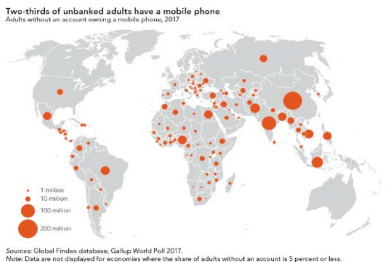
Рисунок 2 – Не охваченные банковскими услугами люди, которые имеют мобильные телефоны